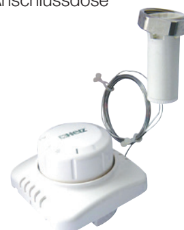
Fernversteller UNI UP