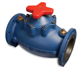
HERZ Strangreguliertventil HERZ Double Regulating Valve