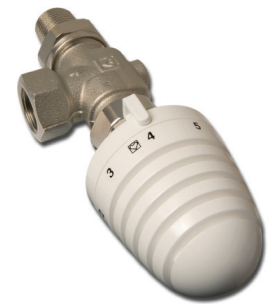
HERZ Thermostatkopf DESIGN HERZ Thermostatic Head DESIGN