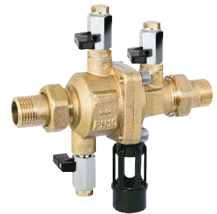
HERZ Systemtrenner 3010 HERZ Backflow Preventer 3010

Pipe connection system and ball valves for different field of application. Valves for system distribution and drinking water hygiene.