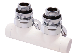
HERZ DE LUXE

Excellence in radiator valves, perfect styling and elegant design.