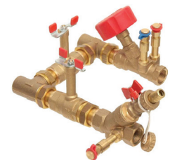
HERZ CONNECT 4