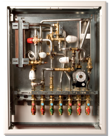
HERZ Wohnungsübergabestation HERZ Hydraulic Interface Unit

FCU or cooling ceilings installation with combi-valves SMART and HERZ zone valves