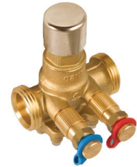
HERZ 4006 SMART

Flow rate controller and Combi-Valve Two- or Three-Port Valves