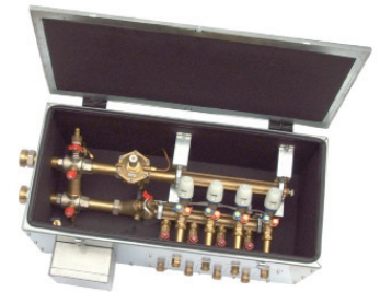
HERZ Commissioning Center

HERZ with studded panel and tacker panel system.