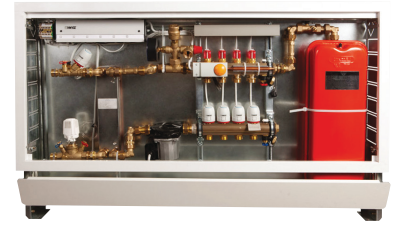
HERZ COMPACTFLOOR FWW

valve with underfloor heating distribution Return temperature limiter 8100.