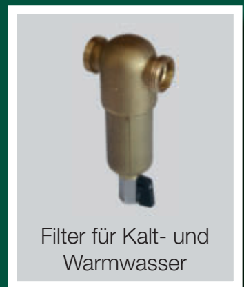
Filter für Kalt- und Warmwasser

Komplettanbieter im Trinkwasserbereich seit 1896