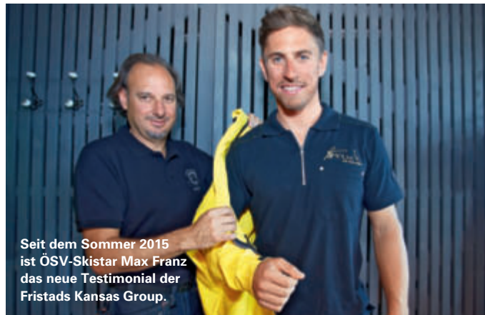
Seit dem Sommer 2015 ist ÖSV-Skistar Max Franz das neue Testimonial der Fristads Kansas Group.

D er Arbeits- und Schutzbekleidungsmarkt boomt. Noch nie zuvor wurde so viel Geld für den Schutz und den Arbeitskomfort der Mitarbeiter ausgegeben wie heute. Neben großen Konzernen wissen mittlerweile auch kleine Firmen und Privatpersonen die Vorteile der funktionellen Arbeitsbekleidung zu schätzen. Die Branche hat sich in den letzten Jahrzehnten einem deutlichen Wandel unterzogen. „Aktuell geht der Trend hin zu qualitativ hochwertiger Arbeits- und Schutzbekleidung, die Funktionalität und das Preis-Leistungs-Verhältnis sind der ausschlaggebende Faktor. Arbeitsbekleidung darf in diesem