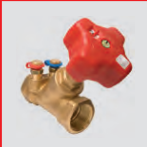
4017 M Strangregulierventil