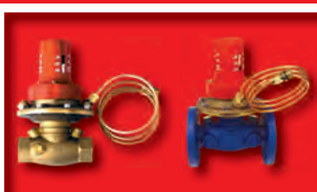
DIFFERENZDRUCKREGLER 4007 FIX mit einem fix eingestellten Differenzdruck von 23 kPa, geflanscht und mit Gewindemuffe verfügbar