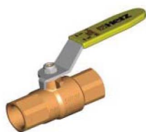
1 2300 0x