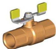
1 2300 1x