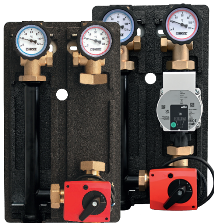
PUMPFIX BASIC MIX 1 4510 71