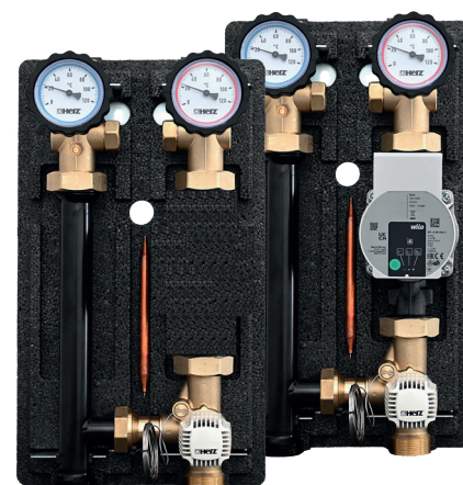
PUMPFIX BASIC CONSTANT 1 4510 51