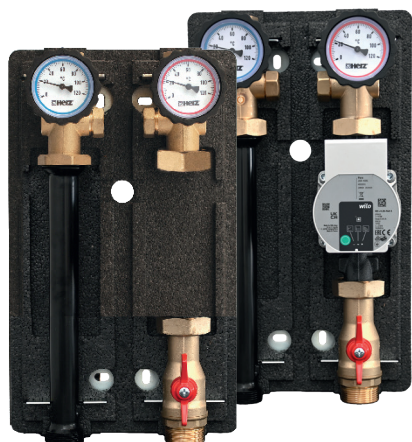
PUMPFIX BASIC DIRECT 1 4510 51